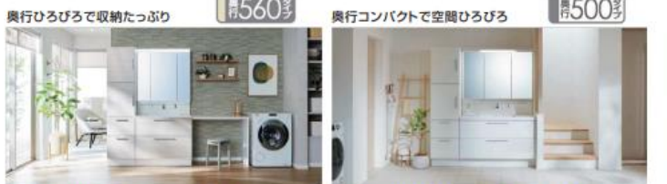
写真品番: RAFH-905JY-A/DN2FA 他 価格(税別): ¥695,000 写真品番: RBFH-1205JY-A/YS2HA 他 価格(税別): ¥607,000